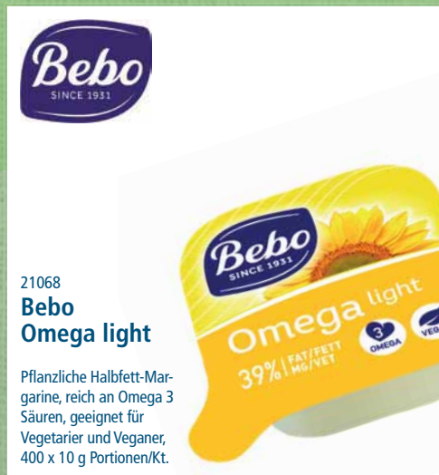
21068 Bebo Omega light

allergenfrei, ohne Salz, zum Braten, Dünsten, Abschmelzen, geeignet für Vegetarier und Veganer, 3 x 5 l Kanister