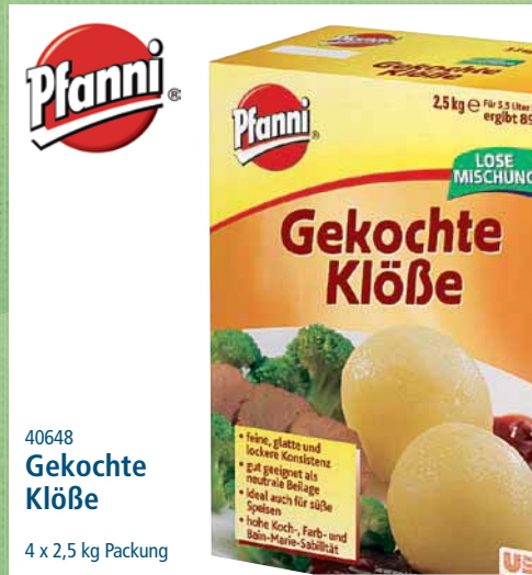
40648 Gekochte Klöße