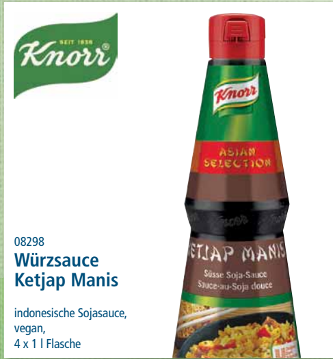
08298 Würzsauce Ketjap Manis

mit pikantem Pfeffer- geschmack und reichhal- tiger Einlage aus grünen, ganzen Pfefferkörnern, 6 x 1 kg Dose