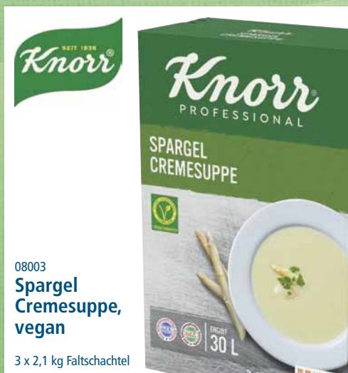
08003 Spargel Cremesuppe, vegan

Arome Universal, zum Würzen und Verfeinern, 12,5 kg Eimer