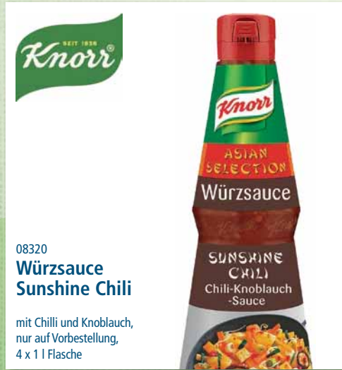
08320 Würzsauce Sunshine Chili

indonesische Sojasauce, vegan, 4 x 1 l Flasche