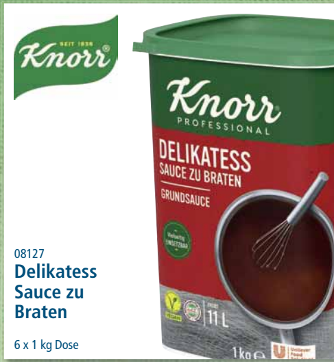
08127 Delikatess Sauce zu Braten