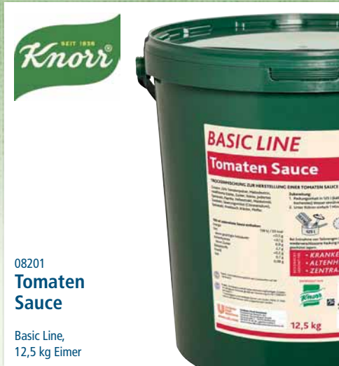
08201 Tomaten Sauce