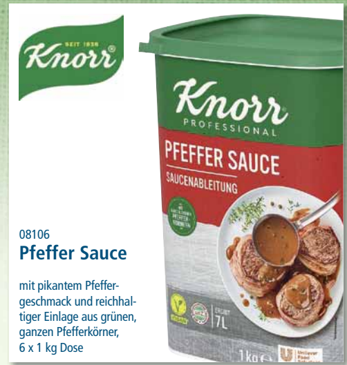
08106 Pfeffer Sauce

mit pikantem Pfeffer- geschmack und reichhal- tiger Einlage aus grünen, ganzen Pfefferkörnern, 6 x 1 kg Dose