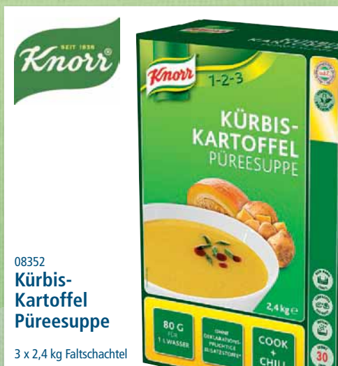
08352 Kürbis- Kartoffel Püreesuppe