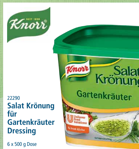
22290 Salat Krönung für Gartenkräuter Dressing