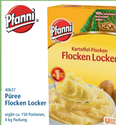
40637 Püree Floccen Locker

je 15 x Tomatencreme, Champignoncreme, je 10 x Kräutercreme, Pfälzer Art, 50 x 25 g Dosen/Karton