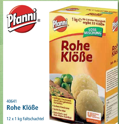
40641 Rohe Klöße