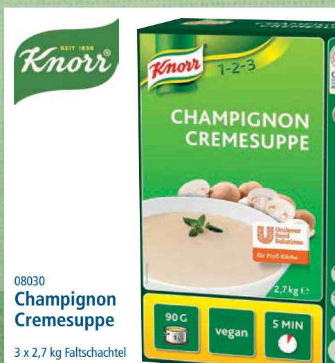
08030 Champignon Cremesuppe