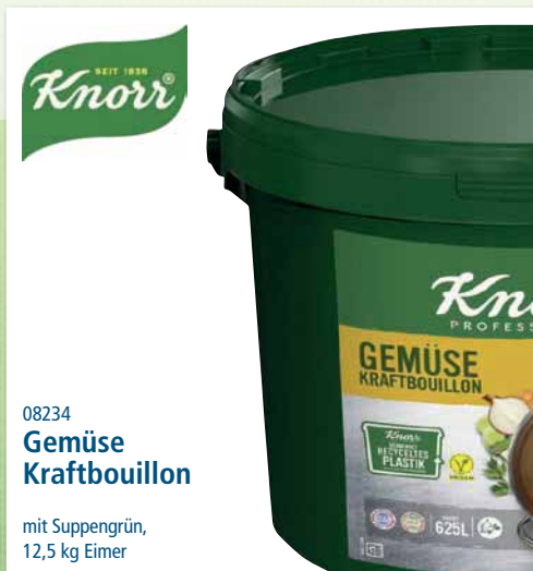
08234 Gemüse Kraftbouillon