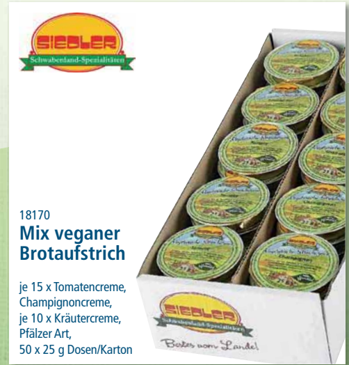
18170 Mix veganer Brotaufstrich

mit Chili und Knoblauch, nur auf Vorbestellung, 4 x 1 l Flasche