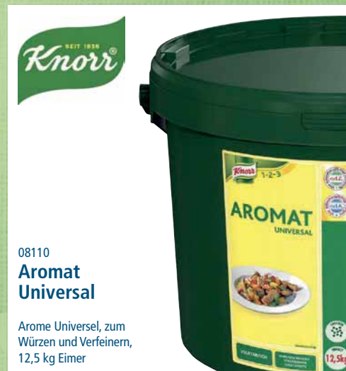
08110 Aromat Universal

Arome Universal, zum Würzen und Verfeinern, 12,5 kg Eimer