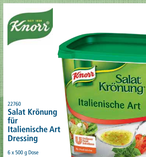
22760 Salat Krönung für Italienische Art Dressing