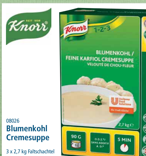
08026 Blumenkohl Cremesuppe