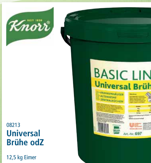
08213 Universal Brühe odZ