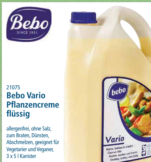
21075 Bebo Vario Pflanzencreme flüssig

allergenfrei, ohne Salz, zum Braten, Dünsten, Abschmelzen, geeignet für Vegetarier und Veganer, 3 x 5 l Kanister