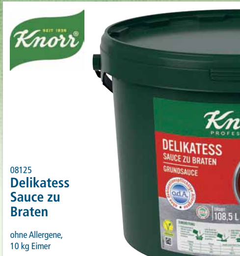
08125 Delikatess Sauce zu Braten