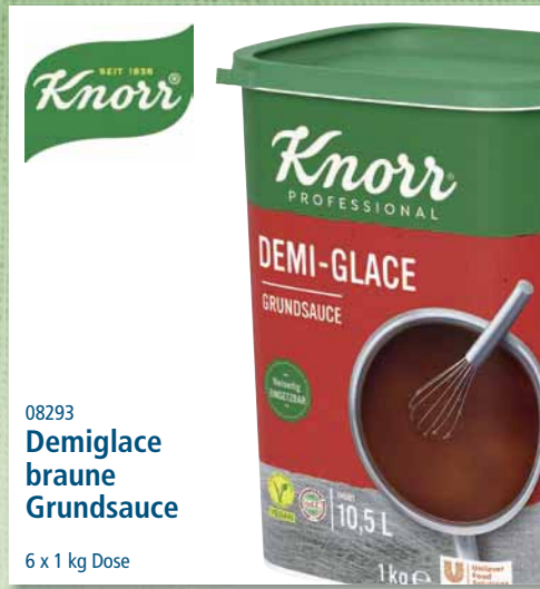
08293 Demiglace braune Grundsauce