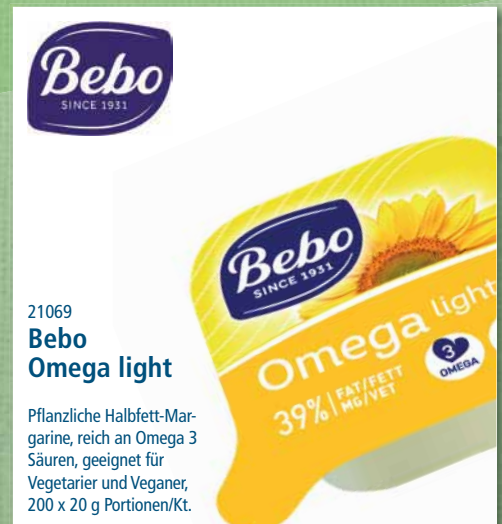
21069 Bebo Omega light

Pflanzliche Halbfett-Mar- garine, reich an Omega 3 Säuren, geeignet für Vegetarier und Veganer, 400 x 10 g Portionen/Kt.