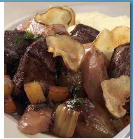
Goulasch de cerf, Kt. 4 x 2,5 kg