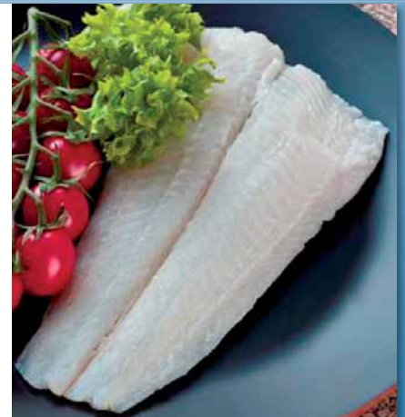
ohne Haut, je Filet 100 - 200 g, Filet de flétatn, 1 kg Beutel/sachet