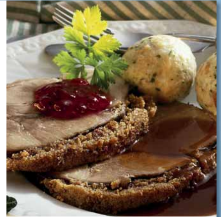
ohne Knochen, Stück ca. 6 kg, Kt. ca. 15 - 20 kg, Gigot de sanglier sans os surgelé, pièce d'env. 6 kg, carton de 15 - 20 kg