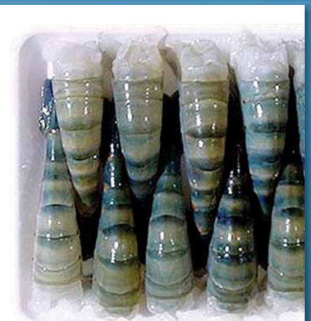
ohne Kopf, mit Schale, 1 kg Beutel

Wir sind zertifiziert: Regelmäßige freiwillige Überwachung nach DIN EN ISO 9001