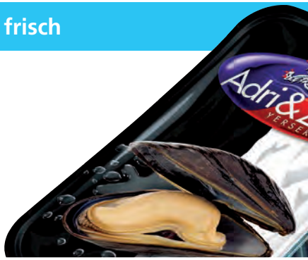
1 kg vakuum Packung