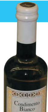
Flasche 0,5 ltr.