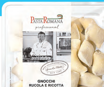
1 kg Schale