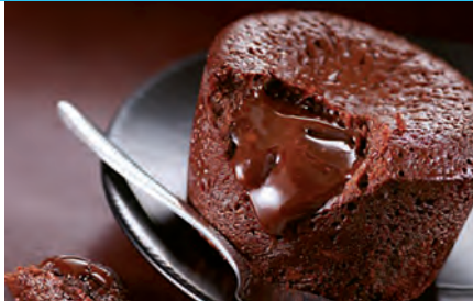
Schokoladenkuchen mit einem sämigen Schokoladenherz, 90 g St., 10 Stück im Karton