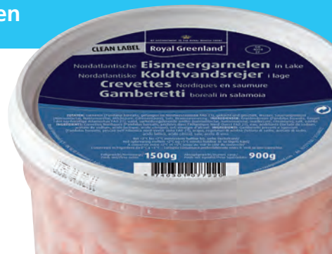
Becher 1 kg, von Royal Greenland