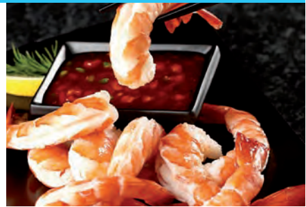
gekocht und geschält, mit Schwanzsegment, 1 kg Bt.