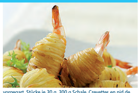
vorgegart, Stücke je 30 g, 300 g Schale, Crevettes en nid de p.d.t., Pièce d'env. 30 g, Barquette 300 g