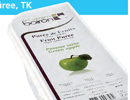
1 kg Schale, Purée de pomme verte surgelé 1 kg, von Boiron