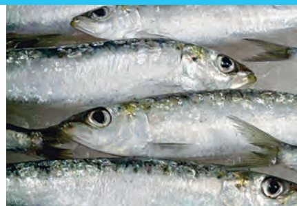
500 g Beutel