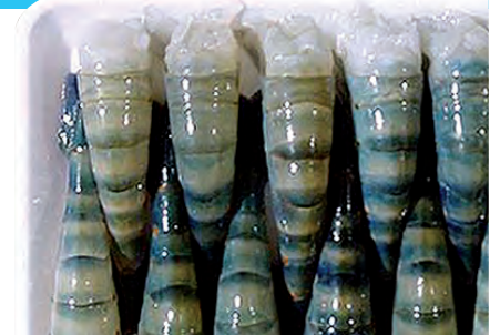
ohne Kopf, mit Schale, 1 kg Beutel