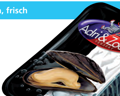
1 kg vakuum Packung