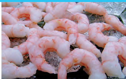
gekocht und geschält, Crevettes grises, cuites, épluchées, 1 kg Beutel/sachet