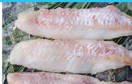
ca. 130 g Stücke, IQF, 1 kg Bt., Filet de sébaste, sans peau, pièces de 130 g, surgelé, sachet d" 1 kg, Karton 10 x 1 kg