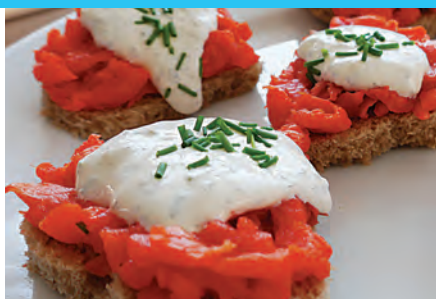
1 kg Schale