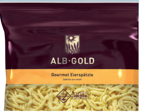
Spätzles fraîches, 2,5 kg Beutel/Sachet