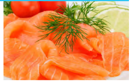
geschnitten, Seite ca. 1 kg, Saumon d'Ecosse, fumé, tranché, surgelé, 1 kg