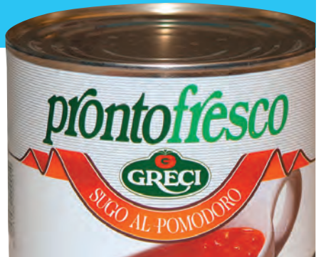
Sugo al Pomodoro, 800 ml Ds.