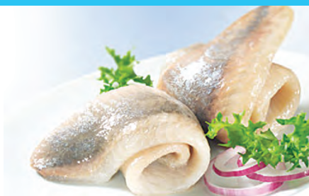
ca. 30 Stück im Eimer, Eimer 2,5 ltr., Harengs à l'huile, 35 par seau, seau de 2,5 l