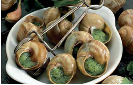
nach Elsässer Art, groß, 48 Stück im Beutel, Escargots d'Alsace, gros, surgelés, 48 pièces par sachet, Française de Gastronomie