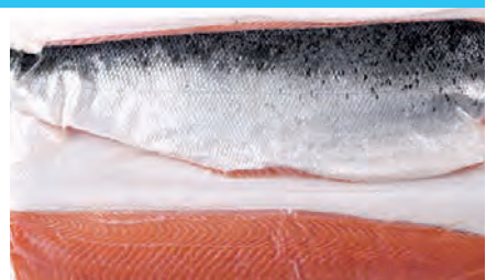
roh, mit Haut, Trim D, einzeln vak. verp., Farbe 14 +, je Seite 800 - 1.200 g, Karton ca. 10 kg, Filet de saumon sauvage cru, surgelé, avec peau emb. ind., 0,8 - 1,2 kg/pièce