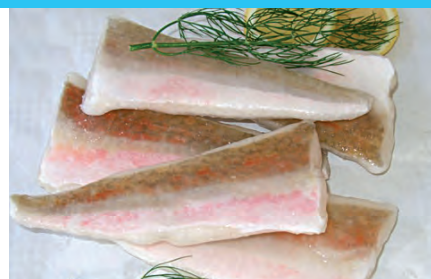
je Filet 100 - 150 g, Filet de grondin, 100 - 150 g pièce, 1 kg Bt./Sachet