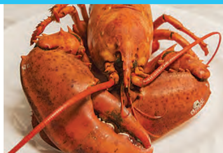
Homard surgelé, Stück ca. 300 g