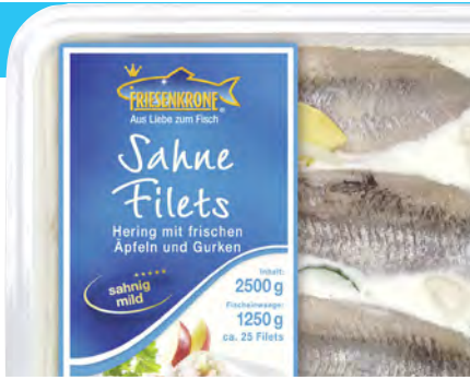
Filets de harengs à la crème, ca. 25 Stück/pièces, 2,5 kg Schale/Barquette