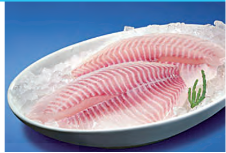
je 140 - 160 g Stücke, Karton 5 kg