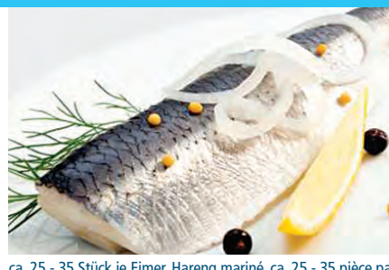
ca. 25 - 35 Stück je Eimer, Hareng mariné, ca. 25 - 35 pièce par seau, Eimer 2,5 liter/seau