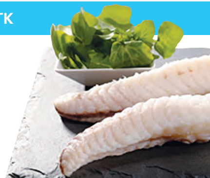
je Filet 100 - 200 g, 1 kg Bt.